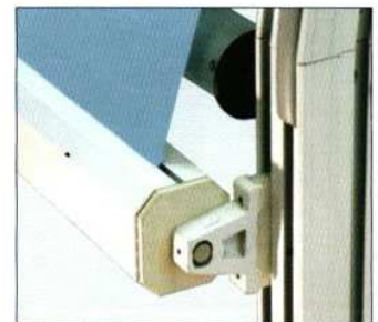
DETTAGLI TECNICI – SERIE ATTICI